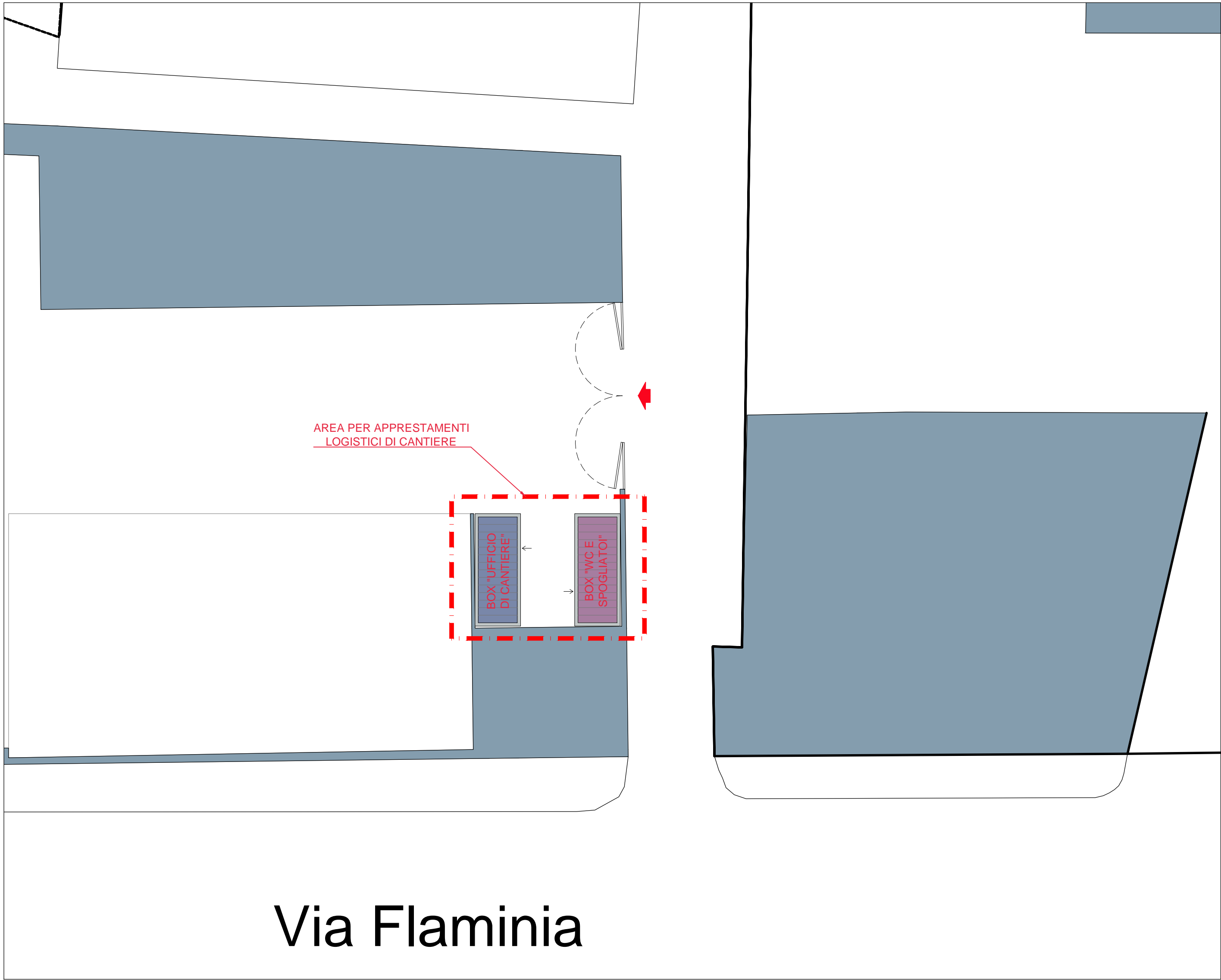
DETTAGLIO AREA APPRESTAMENTI LOGISTICI DI CANTIERE - SCALA 1:200