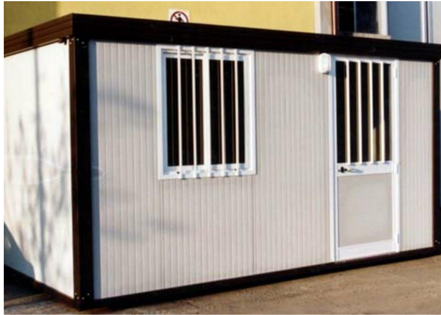
BOX PREFABBRICATO PER UFFICIO DI CANTIERE

In questa prima fase verranno posizionati gli apprestamenti di cantiere. Dal momento che lo spazio in cui si prevede di installare il cantiere logistico è davvero piuttosto limitato, con qualche difficoltà per la gestione riguardante la manovra per l'ingresso/uscita dei mezzi, lo scarico dei materiali e la possibilità stessa di operare in sicurezza all'interno del cantiere, nell'ottica di rendere più fluido il passaggio di mezzi e maestranze, si è scelto di collocare le baracche relative agli spogliatoi, wc e ufficio di cantiere, in una zona vicino al parcheggio dell'Università, di proprietà della Sapienza, collocato nella via adiacente a sinistra della via Mariano Fortuny e che dista non più di 190 metri dall'area operativa del cantiere dove in una porzione di terreno verso il Laboratorio del Museo dei Bambini verranno posizionati i cassoni per lo stoccaggio dei materiali e un deposito attrezzature per i DPI.